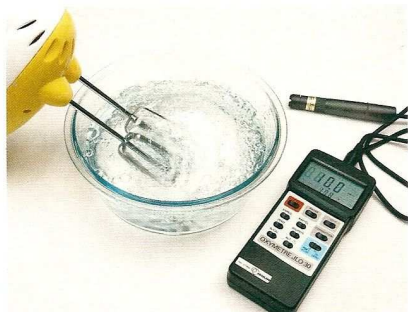
Écran A : avant agitation