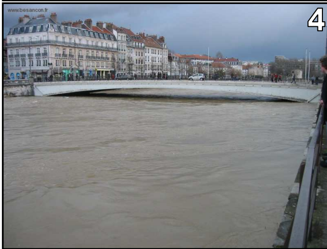
Tableau à compléter :