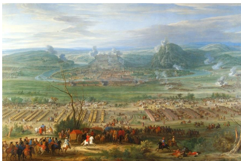
Van der Meulen, La prise de Besançon en 1674

Lettre de Vauban à Louvois, du 26 avril 1674