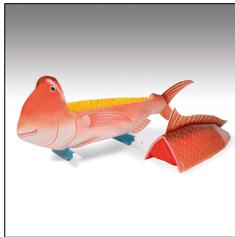
Exemple de cercueil figuratif ghanéen.

Plus anciens, puisqu'ils apparaissent dans les années 1950, les cercueils du Ghana sont destinés à honorer la mémoire du défunt en symbolisant l'activité terrestre qui fit leur réussite et celle de leur clan. Quelques ateliers de menuiseries proches d'Accra, la capitale, se sont spécialisés dans la production de cercueils aux formes variées, réalistes et colorées : poisson ou pirogue pour les pêcheurs, oignon ou cabosse de cacao pour les planteurs de ces denrées, ou encore poule, automobile, avion... Bien que réservées à une riche élite, ces sépultures sont très populaires au Ghana. En 1989 une exposition du Centre Pompidou, un film puis un livre de Thierry Secretan, révélèrent au monde comment des artistes ghanéens transformaient nos séculaires boîtes en sapin en objets de glorification du défunt.