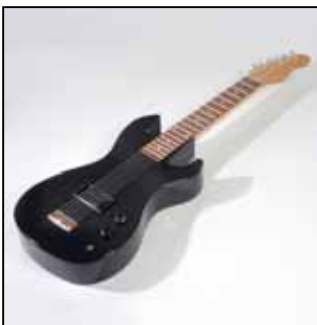
Cercueil anglais / Vic Fearn

Partir en beauté dans un lion, un chausson de danse, une guitare électrique, un DC10 ou un cerf-volant ne relève plus d'un imaginaire à la Prévert. Lorsque la modernité fait irruption dans des traditions ancestrales, nos séculaires boîtes de sapin se transforment en objets de glorification du défunt. Que ce soit en Afrique depuis les années 1950 ou en Europe depuis une décennie, le nombre de personnes enterrées ou incinérées dans ces œuvres d'art éphémères augmente chaque année.