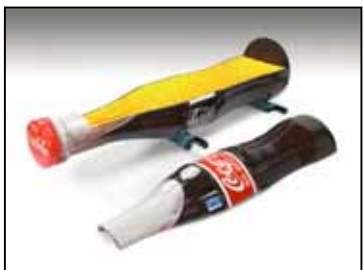
Bouteille de Coca