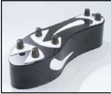
Chaussure de foot