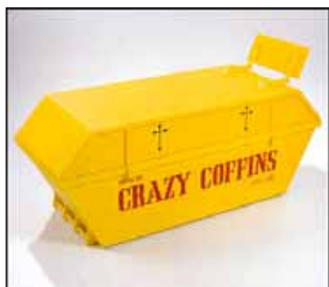
Benne à ordure