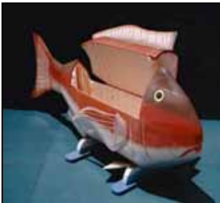
Cercueil Ghanéen / Thierry Secretan

Cette année, le musée poursuit cette orientation, avec une exposition exceptionnelle, conçue et réalisée à Besançon, sur les cercueils figuratifs du Ghana et d'Angleterre. Phénomène récent et inconnu en France, on découvre ainsi que le traditionnel cercueil peut prendre des formes insoupçonnées.