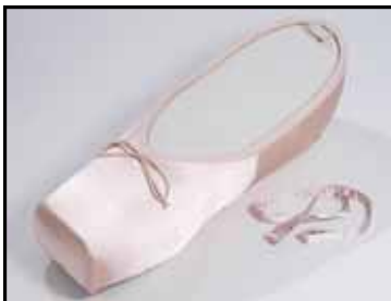
Ballerine de danse