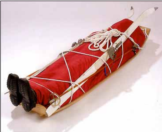
Cercueil anglais / Luge, Vic Fearn

L'histoire fut reprise petit à petit par tous les journaux anglais y compris par le vénérable Times , cet afflux de publicité entraînant les commandes auprès de Vic Fearn . Ainsi, cinquante ans environ après leur invention au Ghana, les cercueils figuratifs faisaient sensation en Europe et des émules en Angleterre.