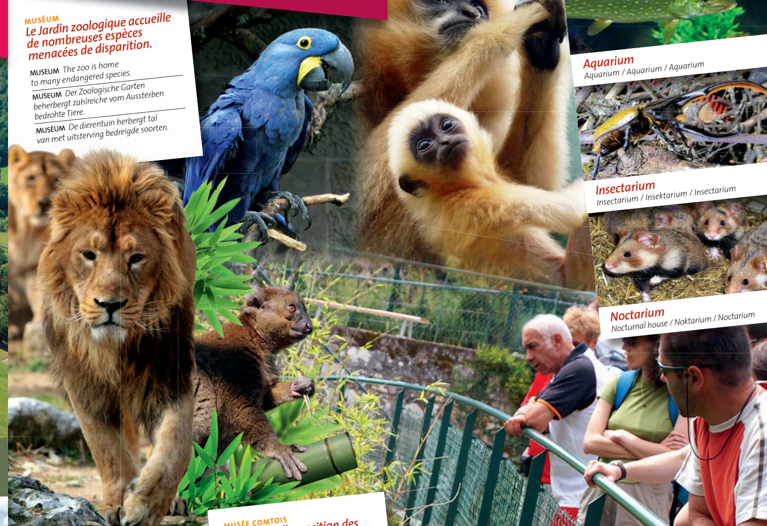
Aquarium Aquarium / Aquarium / Aquarium