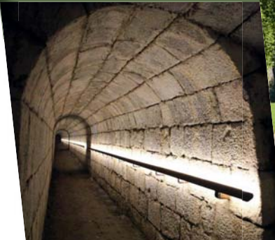
UN SITE EXCEPTIONNEL Patrimoine mondial de l'Unesco, chef-d'œuvre de Vauban. AN EXCEPTIONAL SITE UNESCO World Heritage Site, fortifications of Vauban. EINE AUSSERGEWÖHNLICHE STÄTTE Welterbe der UNESCO, Bauwerk von Vauban. EEN UITZONDERLIJKE PLEK Werelderfgoed van de Unesco, bouwwerk van Vauban.