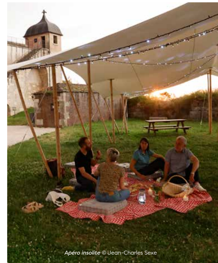
Apéro insolite