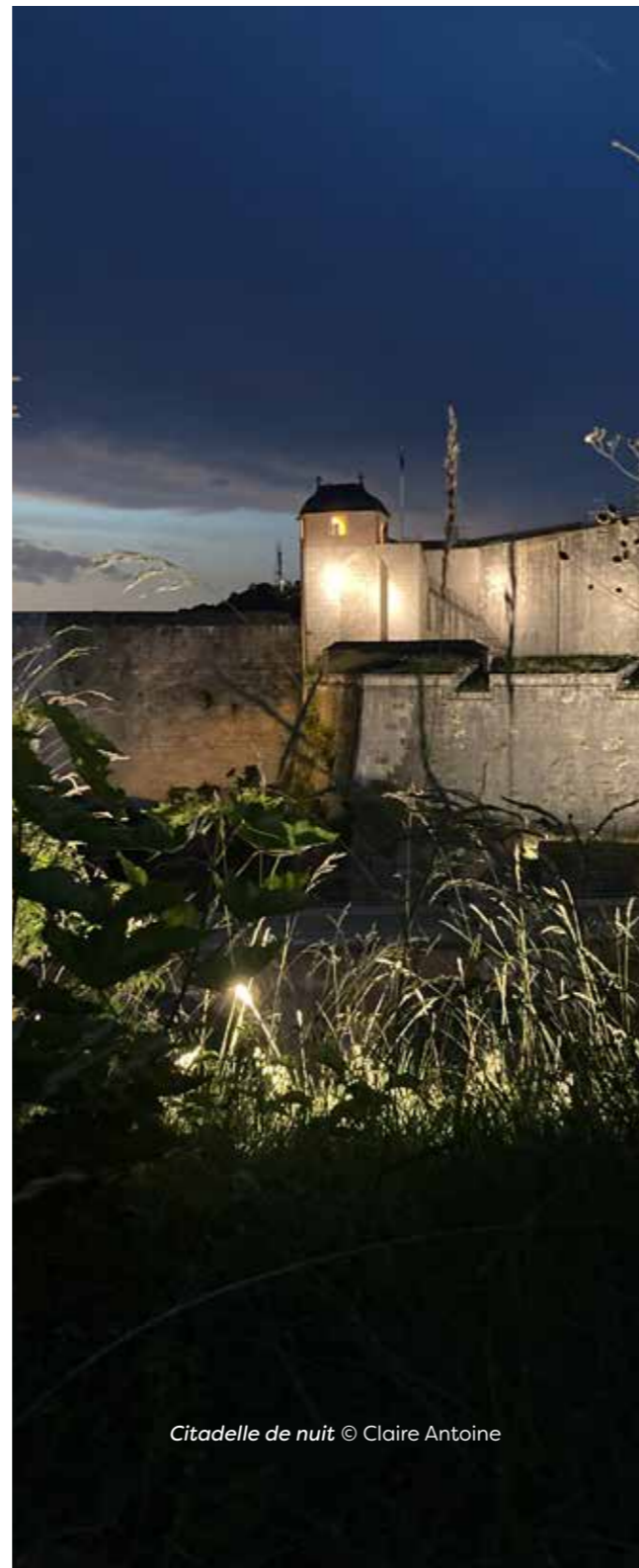
Citadelle de nuit

Tout public • Tarif 5 € • Ouverture des portes à 20h30 (début de séance à la tombée de la nuit) • Réservation en ligne ou sur place le jour-même en fonction des places disponibles