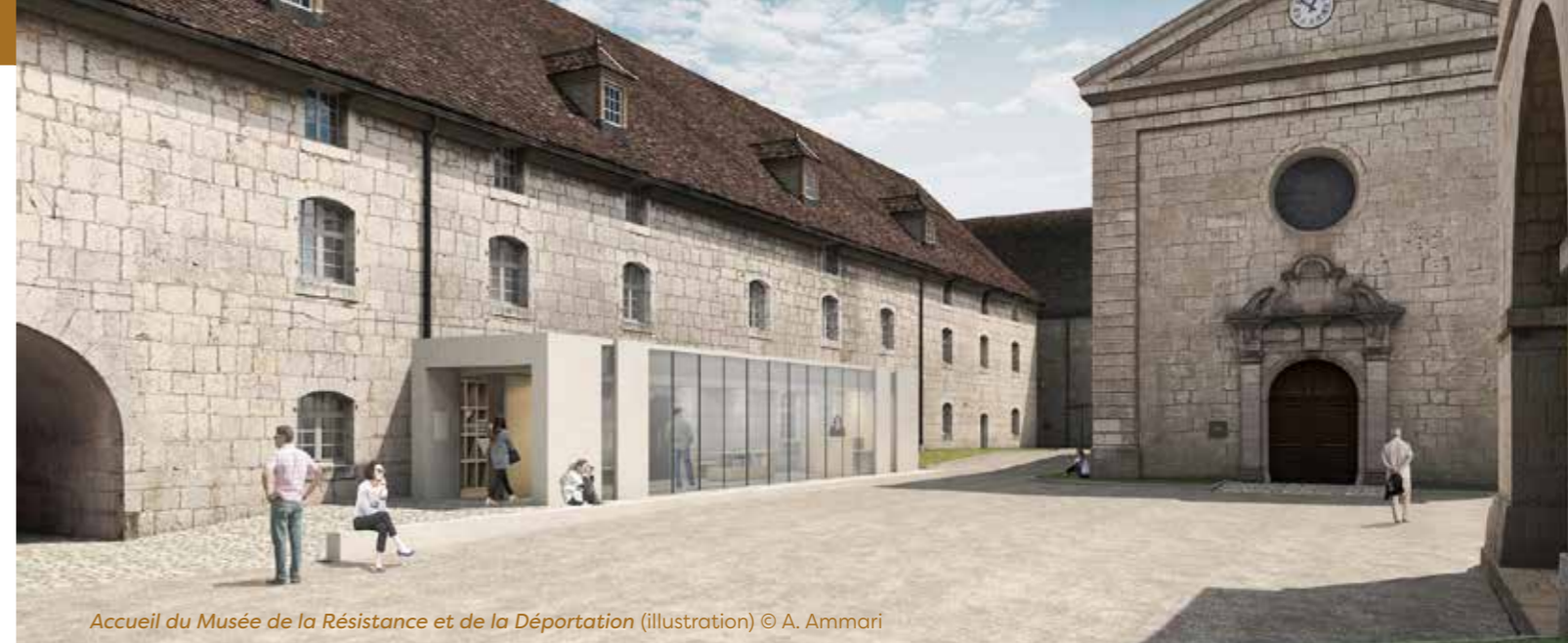
Accueil du Musée de la Résistance et de la Déportation (illustration)